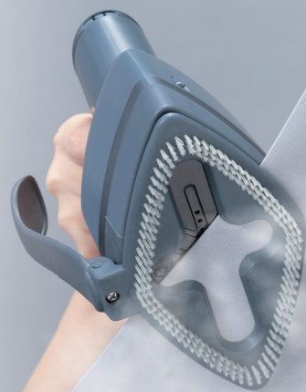
ズボンのセンターライン