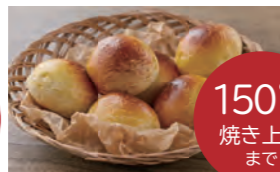
150°C 焼き上げ まで