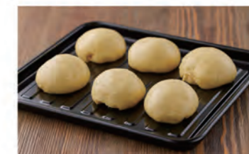
安定した温度でパンの発酵に

ムラなくしっかりと熱を循環・対流させるので、焦がさず均一に低温調理が可能です。パンの発酵だけでなく、チーズフォンデュやチョコレートフォンデュ、調理に使用する溶かしバターやソース作りなど、色々な場面で活躍します。