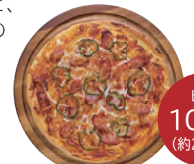
ピザ 10インチ (約25cm)