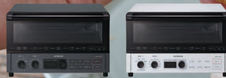
ストーンブラック(B) HMO-F200