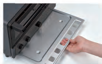
パンくずトレイで、清潔な庫内