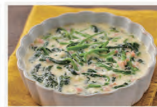
ほうれん草のクリーム煮