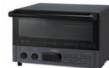
ストーンブラック（B）