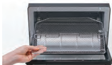
焼き網は、取り外して丸洗い可能

焼き網はカンタンに取り外せて丸洗いが可能です。下に落ちたパンくずなどは、パンくずトレイがスライドイン式で取り外せるので、調理後のお手入れがしやすく、いつも庫内を清潔に保てます。