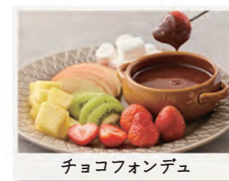
チョコフォンデュ