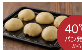
40°C パン発酵 から