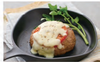
熱風対流調理でふっくら仕上げ

日立のコンパクトオープントースターは、循環ファンと遠赤外線ヒーターで、熱風対流（コンベクション）調理が可能です。ファンから送られた熱風が、食材を包み込むようにしっかり焼き上げ、ムラを抑えてふっくら仕上げます。