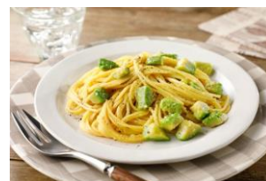
アボカドクリームパスタ by ぶよりんご