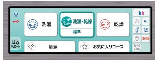
ワイドカラー液晶タッチパネル

本製品に加え、「除菌清潔プラス」コース、「快速洗乾」コース、「[抗菌]糸くずフィルター」を搭載したドラム式洗濯乾燥機BD-SX110Gと、洗濯容量12kg・乾燥容量7kgで奥行スリムタイプのドラム式洗濯乾燥機BD-NX120Gの計3機種を発売します。