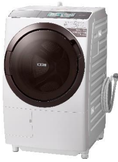
BD-STX110G フロストホワイト(W)

本製品は、大きな画面で見やすく使いやすい「ワイドカラー液晶タッチパネル」を採用したほか、水で洗えないものも除菌 (*)2 ・消臭、さらにウイルス抑制する (*)3 「除菌清潔プラス」コース (*)4 や約95分でしっかり洗ってきれいに乾かす「快速洗乾」コース (*)5 、「[抗菌 (*)6 ]糸くずフィルター」を新たに搭載しました。