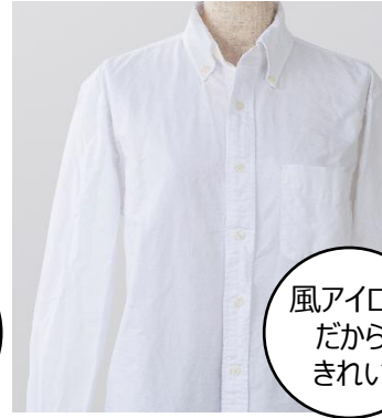
風アイロン だから きれい