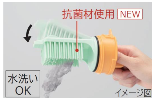
図5：[抗菌]糸くずフィルター

糸くずフィルターのかしの部分に抗菌材を採用し、清潔性に配慮しています。また、かしの本数を増やした(*9)新形状により、糸くずが集めやすくなりました。