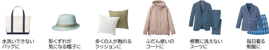
水洗できない バッグに

湿気を含んだ温風で衣類を加熱して約60分の運転で除菌・消臭、さらにウイルスを抑制します。バッグや帽子、クッションなど水で洗えないものや、コートや制服など頻りに洗濯ができなくて困っていたものも清潔にできます。