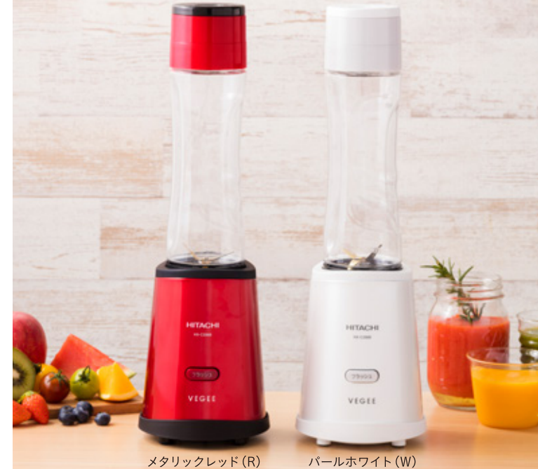
メタリックレッド (R)