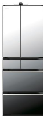
クリスタルミラー(X)

https://www.youtube.com/watch?v=cLZJNpsYO-g