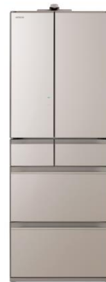
クリスタルシャンパン(XN)