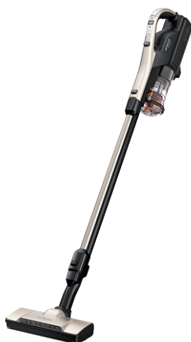
シャンパンゴールド(N)