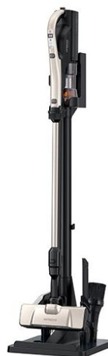
スタンド式充電台 収納状態