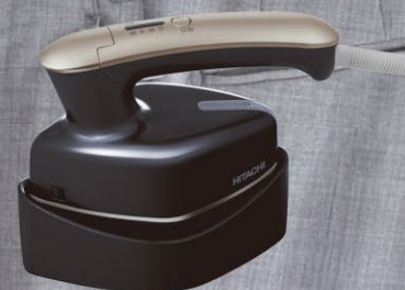
オニクスブラック(B)

商品の価格には、配送・設置調整・別売部品・工事・使用済み商品の引き取り等の費用は含まれておりません。