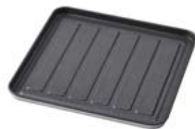
写真はイメージです。