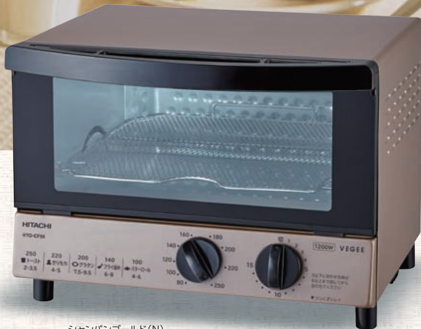
シャンパンゴールド(N)