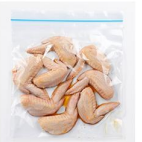
鶏手羽先のつけ焼き