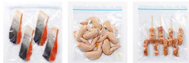
塩ざけの場合 鶏手羽先のつけ焼き 焼き鳥(塩)