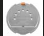
オートスチーマープレート