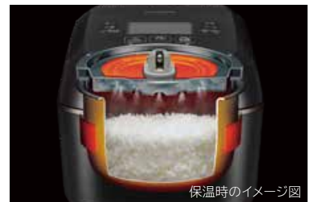
保温時のイメージ図

*1 RZ-W100EM:炊き方「白米・極上ふつう」コース0.54L(3合)炊飯時、標準水量0.58L(580mL)に対して排出蒸気量4.6mL(約0.8%)。排出蒸気量が多いコースで測定した場合:炊き方「白米・おかゆ」コース0.09L(0.5合)炊飯時、標準水量0.445L(445mL)に対して排出蒸気量4.8mL(約1.1%)。蒸気口のまわりが熱くなりますのでご注意ください。炊飯コースや周囲環境によって蒸気が出る場合がありますので、壁や家具の近く、キッチン用収納棚を使う場合は蒸気が当たらないようご注意ください。