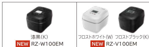
漆黒(K) NEW RZ-W100EM

*1 RZ-W100EM:炊き方「白米・極上ふつう」コース0.54L(3合)炊飯時、標準水量0.58L(580mL)に対して排出蒸気量4.6mL(約0.8%)。排出蒸気量が多いコースで測定した場合:炊き方「白米・おかゆ」コース0.09L(0.5合)炊飯時、標準水量0.445L(445mL)に対して排出蒸気量4.8mL(約1.1%)。蒸気口のまわりが熱くなりますのでご注意ください。炊飯コースや周囲環境によって蒸気が出る場合がありますので、壁や家具の近く、キッチン用収納棚を使う場合は蒸気が当たらないようご注意ください。