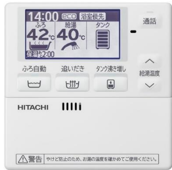
参考:台所リモコン(正面) 扉を閉めた状態

基準:台所リモコン設置後に、リモコン扉を開いた状態で、扉内側に貼付された 型式ラベルの台所リモコン型式「BER-W2FKT」が確認できるように撮影してください。 ラベル印字内容 BER-W2FKT-**** (←末尾4桁「****」は製造ロットNo.)