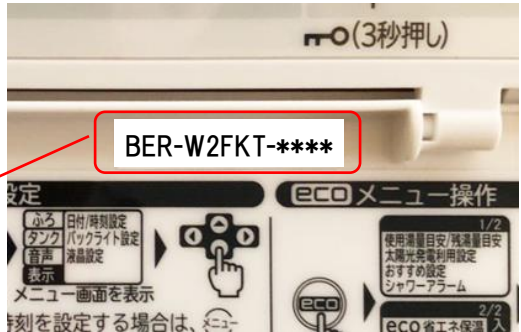
台所リモコンの型式ラベル

無線LANアダプター付属の台所リモコンの 型式ラベル印字内容⇒BER-W2FKT-**** (末尾の4桁「****」は製造ロットNo.)