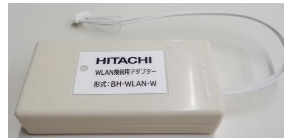
無線LANアダプター(BH-WLAN-Wの例)