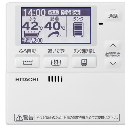
台所リモコン(正面)