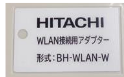
無線LANアダプター ラベル