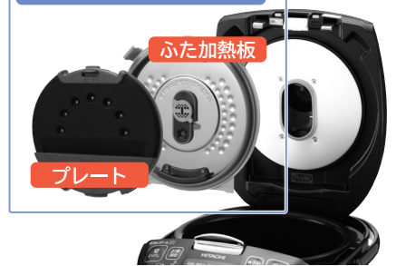
給水レスオートスチーマー