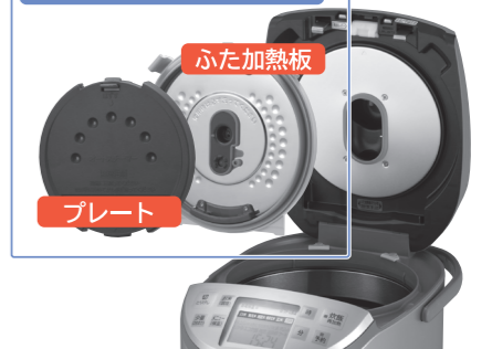
給水レスオートスチーマー