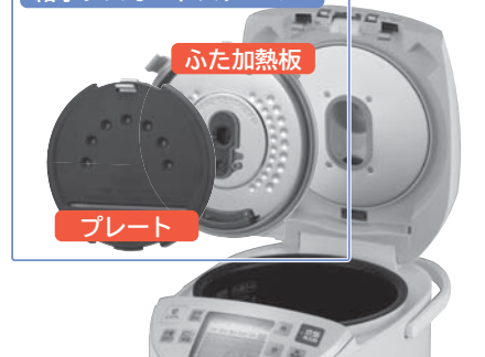
給水レスオートスチーマー